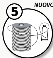
NUOVO FILATO BRILLANTE