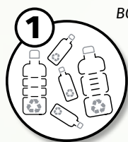
BOTTIGLIE RICICLATE IN PET